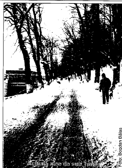
Actualitățile alei de sub Tîmpa