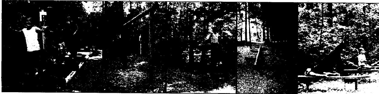
„Imagini cu piste de alergare din alte țări. Sperăm să le putem înlocui curînd cu cele realizate de noi pe alea de sub Tîmpa”

● Proiectul asociației „Cetatea Brașovului”, câștigător al concursului „Țara lui Andrei”, va amenaja o pistă de alergare la poalele Tîmpei